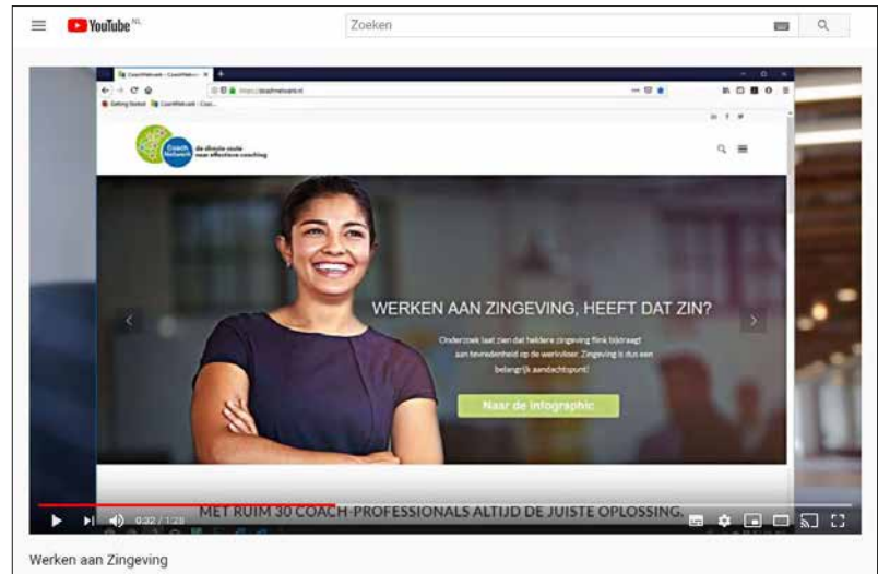
Filmpje over Zingeving