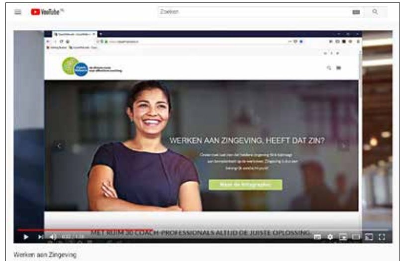
Filmpje over Zingeving